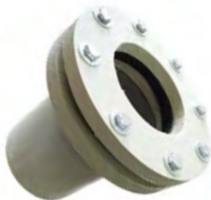
Муфта обсадной трубы