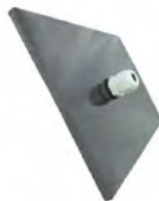
Герметичный кабельный ввод