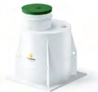
Пластиковый кессон 5 с горловиной